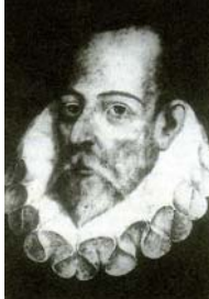
Miguel de Cervantès

Don Quichotte de la Manche est un roman écrit par le grand écrivain espagnol Miguel de Cervantès, entre 1605 et 1615.